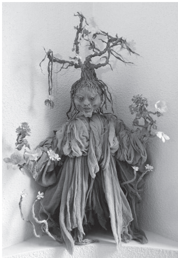
Mutter Erde.

Ohne Netz. Man sollte Kinder –lehren – ohne Netz – auf einem Seil zu tanzen – bei Nacht allein – unter freiem Himmel zu schlafen – in einem Kahn – aufs offene Meer hinausrudern. Man sollte sie –lehren – sich Luftschlösser – statt Eigenheime zu erträumen – nirgendwo sonst – als nur im Leben zu Hause zu sein – und in sich selbst – Geborgenheit zu finden.