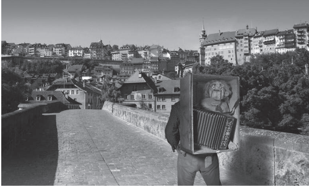
Pont St. Jean.