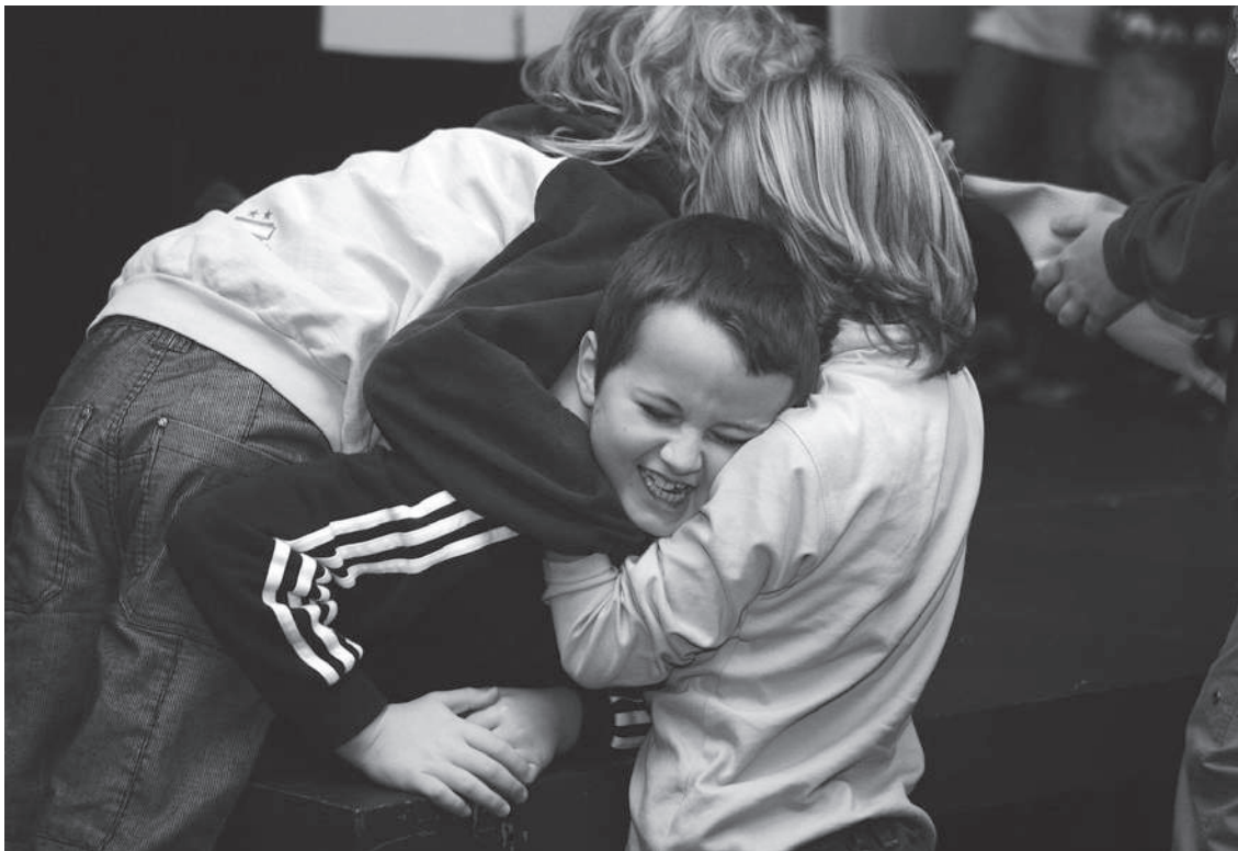
«Premierenklasse» Theater Stadelhofen: zvg.