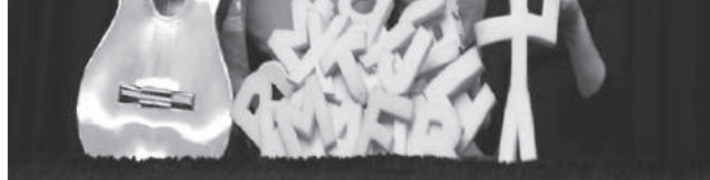
figura 60 2/08

Théâtre Atelier de Marionnettes «La Turlutaine», Nord 67, 2300 La Chaux-de-Fonds, 032 964 18 36, info@laturlutaine.ch, www.laturlutaine.ch.