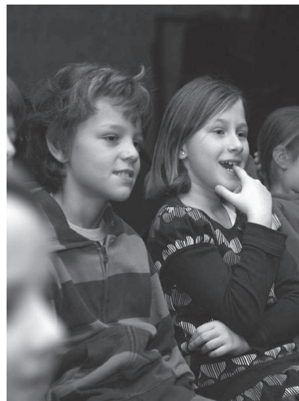
«Premierenklasse» Theater Stadelhofen

Das Referat entstand für das Steps-Symposium Kulturvermittlung «Zwang zum Glück?» vom 15. April 2008 in Zürich. Das Referat wurde für den Abdruck aus Platzgründen von der Redaktion massgeblich gekürzt.