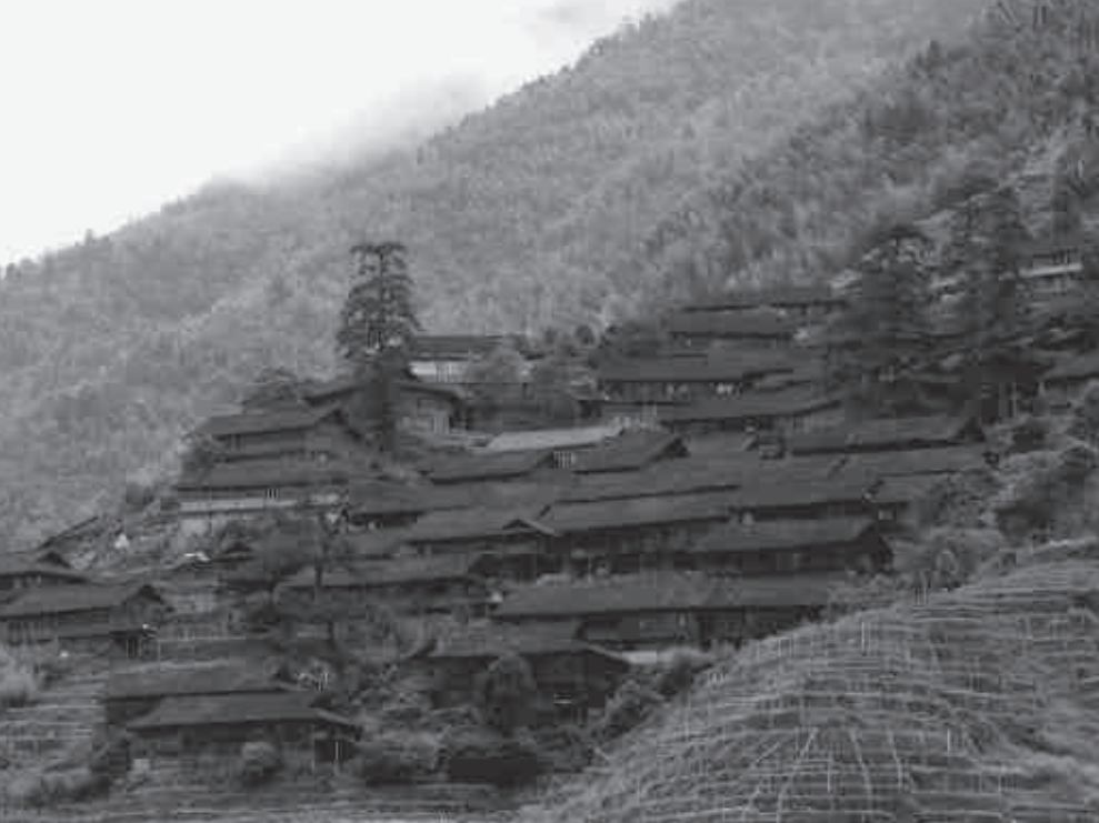
Village / Dorf Dong.