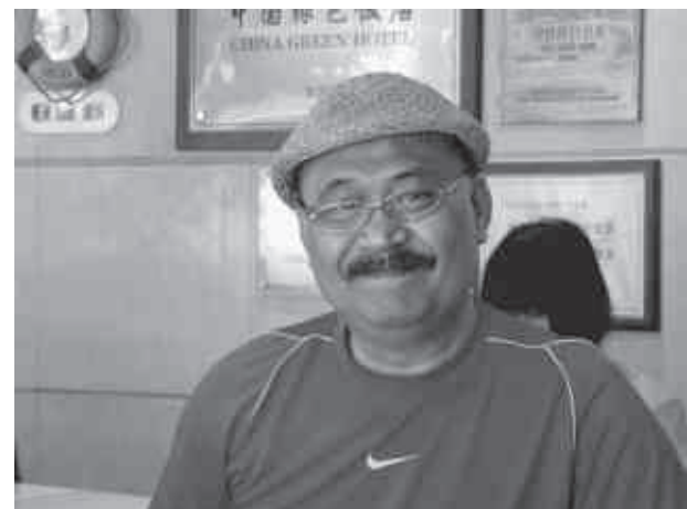
Pierre-Alain Rolle (Texte et photos)