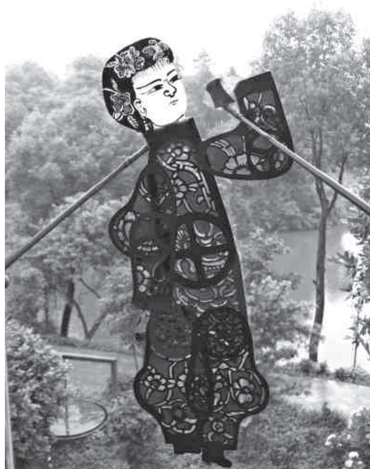
Ombre de carton / Schattenfigur aus Karton.

Les mastodontes des années glorieuses sont engagés dans une lutte féroce pour l'argent. Autour d'eux l'immense vivier du théâtre traditionnel paysan survit envers et contre tout. Pour dix Théâtres de marionnettes financés par l'Etat, il y a mille théâtres dans la campagne dont les seules ressources sont la vente des représentations aux villageois.