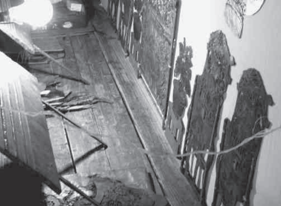
Les décors. Kulissen.